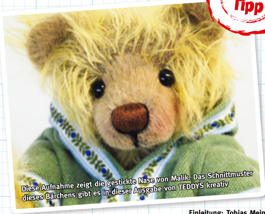
Diese Aufnahme zeigt die gestickte Nase von Malik. Das Schnittmuster dieses Bärchens gibt es in dieser Ausgabe von TEDDYS kreativ